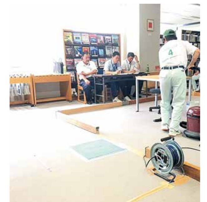
カーペット床清掃