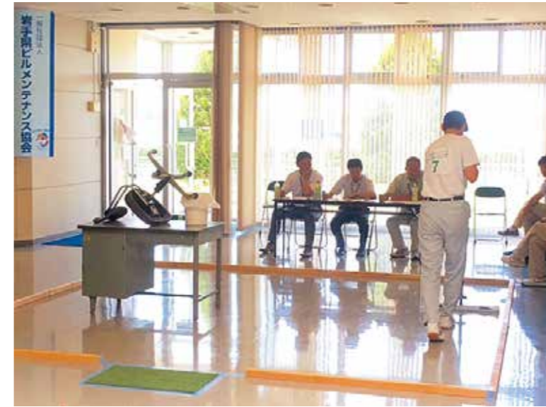
弾性床清掃・机上清掃

去る7月9日(日)にチャレンジいわてアビリンピック2017(第15回岩手県障がい者技能競技大会)が矢巾町にある岩手県立産業技術短期大学校で開催されました。